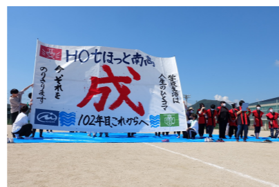
合同運動会での学校アピール (書道パフォーマンス)

健康・安全に関する意識を高めるために生活安全教室や一斉防災教室(地震・津波対策)、学校薬剤師の先生による薬物乱用教室なども実施しています。