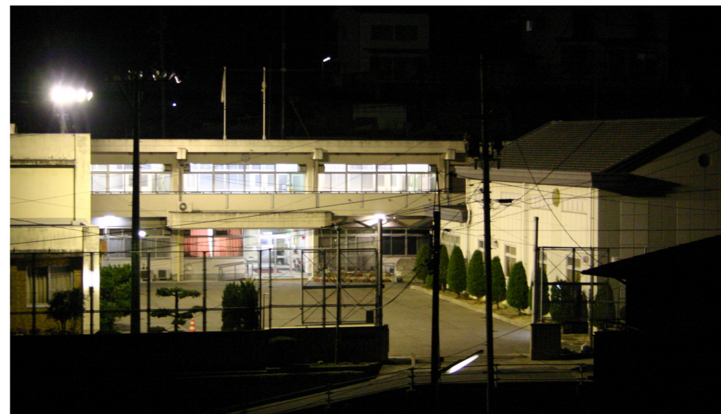
学びと職場のクロスロード