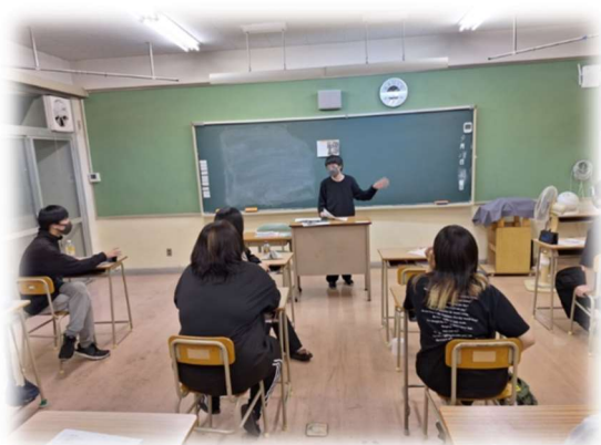
互いの体験を共有する発表