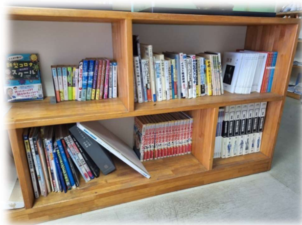
「読書週間」のポスターと玄関文庫

10月27日(日)～11月9日(土)は「読書週間」です。この取組は、大正時代に遡ります。日本図書館協会が図書館をPRする目的で、「図書館週間」として制定したのが始まりだそうです。本校においても、教室や玄関に本棚を設け、本を手に取りやすい工夫をしています。最近、玄関文庫にあった『風琴と魚の町』(林芙美子)を読みました。尾道駅に降り立った一家の生活が綴られた、著者の自叙伝です。ぜひとも一読し、感想を聞かせてください。