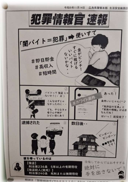
教室に掲示された啓発チラシ

本日は、日付から「110番の日」とされています。意外に歴史は浅く、昭和60(1985)年に制定されたそうです。また、東京では最初から110番でしたが、大阪・京都・神戸では1110番、名古屋では118番等地域によって番号が異なっており、全国で110番に統一されたのは昭和29(1954)年だったそうです。近年「闇バイト」について注意を呼び掛けるチラシが度々警察から届いています。110番を頼りとしながらも、各自気をつけていきましょう。