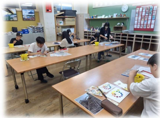
ある日の美術の授業

これは芸術教室に設置されている時計です。時計と言っても何時であるかというのではなく、時間の経過が見える化したものです。本校は45分授業です。授業が始まって、45分から赤い部分が徐々に減っていくという仕組みです。美術や書道は作品を仕上げる事が多く、作業に没頭しているといつの間にか時間が経っているということも多いことでしょう。そんな時にこの時計であれば、時間配分の目安が立てやすいのではないのでしょうか。