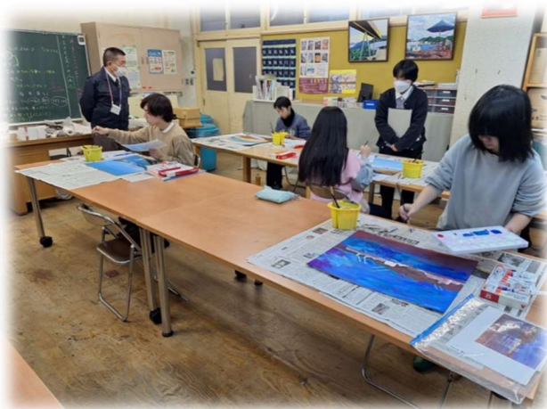
仕上げの段階です

尾道市は平成27年に箱庭的都市として、「日本遺産」に認定されました。その尾道のキャッチフレーズの一つが「ようこそ。日本の心の縮図へ。」です。文字通り心に響くフレーズです。尾道は、春夏秋冬、昼・夜どの季節、時間においても実に風情のある表情を見せてくれます。1年生は現在、尾道の風景を写真に撮り、それをもとに風景画を描いています。海、山、坂、寺…それぞれが捉えた風景とは？ そろそろ仕上げの段階に入っているようです。