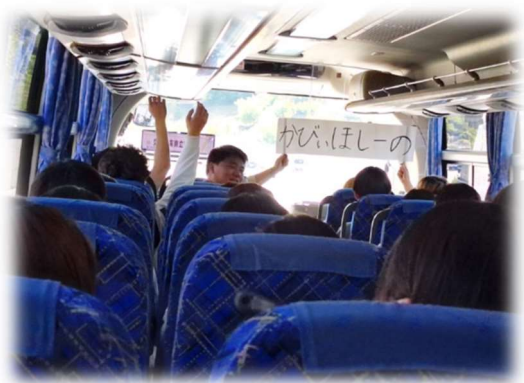
盛り上がったバスの中