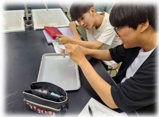
恐る恐る解剖しています