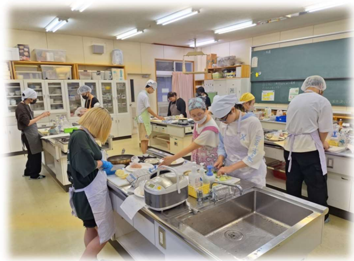
採用されますように…